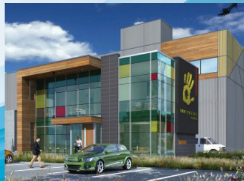
Tricentris, Lachute Chemin Félix-Touchette, Lachute, Québec, Canada