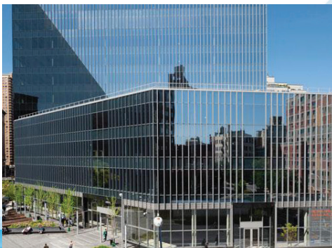
51 Astor 25 Rue Cooper, New York, NY 10034, United States