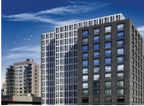
444 10 e Avenue Nord New York, NY 10001. USA

Nous sommes fier fournisseur des projets suivants, soient terminés ou en cours de projets :