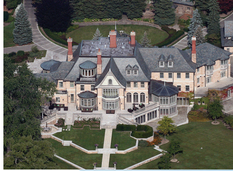
Edgemere 1502 Chemin Lakeshore E. Oakville, Ontario, Canada