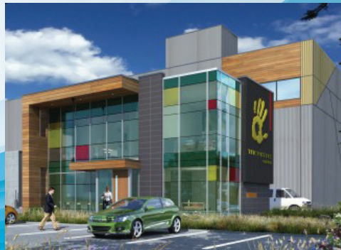
Tricentris, Lachute Chemin Félix-Touchette, Lachute, Québec, Canada