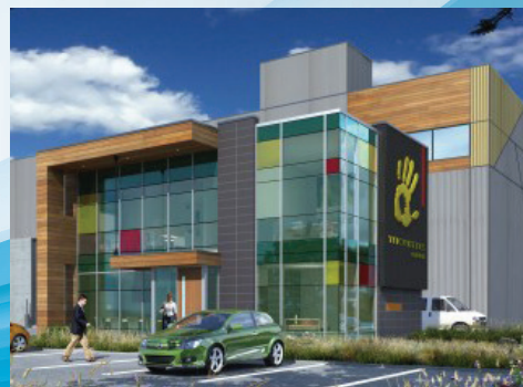
Tricentris, Lachute Chemin Félix-Touchette, Lachute, Québec, Canada