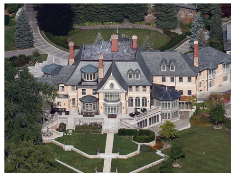
Edgemere 1502 Chemin Lakeshore E. Oakville, Ontario, Canada